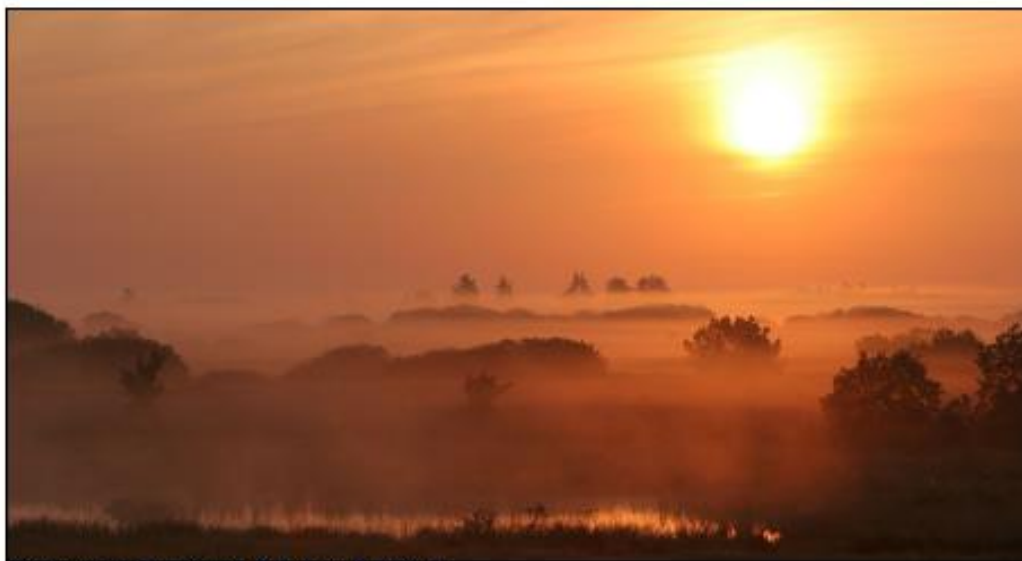
Solopgang over Borris Hede.

Det er en fælles opgave for kommuner og offentlige lodsejere at aftale nærmere på hvilke arealer og i hvilke kommuner, den konkrete indsats skal foregå.